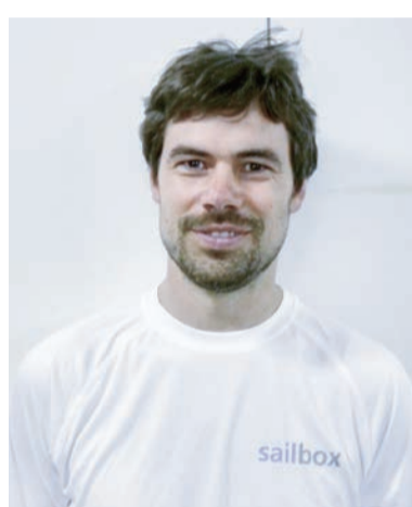
Kis Klenk Trainer Junioresegeln